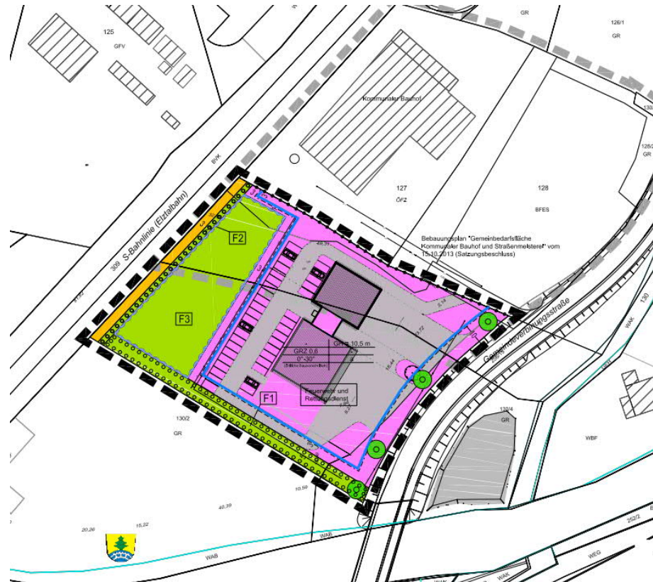
Abbildung 1: Bebauungsplan „Erweiterung der Gemeinbedarfsfläche für Feuerwehr und Rettungsdienst“, Gemeinde Gutach i. Br., Stand Februar 2019

Die Gemeinde Gutach i.Br. plant, im Grenzbereich des kommunalen Bau- und öffentlichen Recyclinghofs einen Standort der freiwilligen Feuerwehr sowie eine Rettungswache des DRK anzusiedeln. Für dieses Vorhaben ist ein neuer Bebauungsplan aufzustellen, der den alten Plan zum Teil überlagert und nach Süden erweitert.